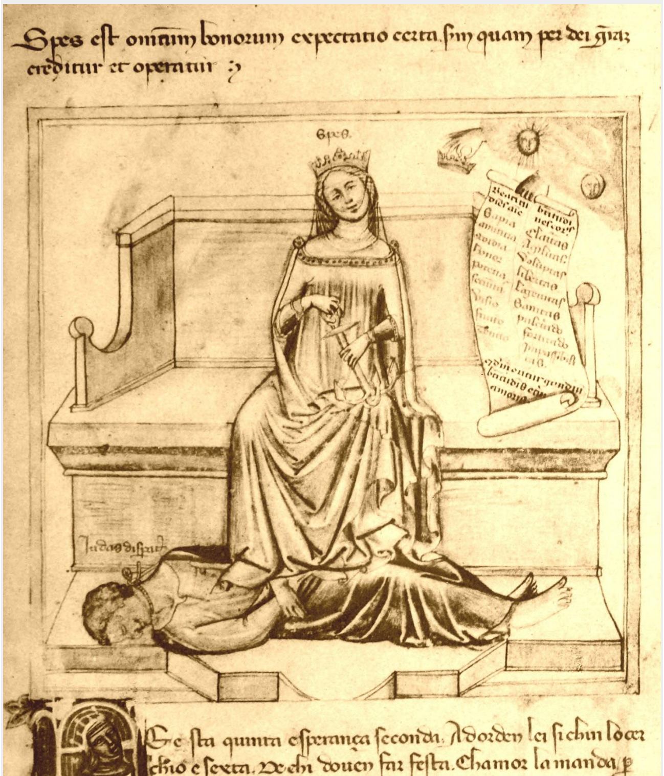
6 | Bartolomeo e Andrea de' Bartoli, Spes e le sue partes . Chantilly, Musée Condé, ms. 1426, f. 5r (da Dorez 1904).