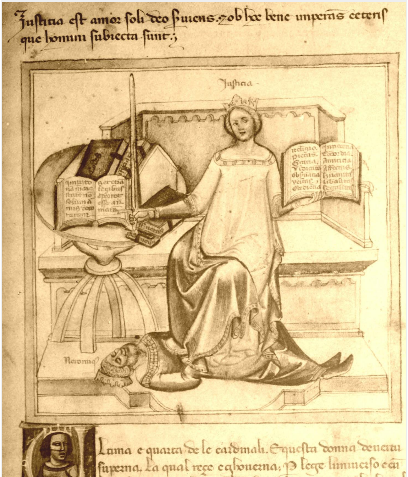
Fig. 4 | Bartolomeo e Andrea de' Bartoli, Iustitia e le sue partes . Chantilly, Musée Condé, ms. 1426, f. 4r (da Dorez 1904).