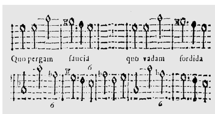
ES. 10, miss. 132-136.

L’uniformità metrica favorisce l’adozione di ripetizioni melodiche su testo diverso in un luogo molto esposto come l’ incipit , dando adito – come già in precedenza (n. 4) – alla presentazione di incisi ripetuti o variati in strutture duali (ES. 10). A ben vedere, anzi, si ravvisa tra le sezioni n. 4 e 6 un rapporto che è motivico ed anche formale: lo si constata, oltreché all’inizio, al presentarsi della terza ‘idea’ (qui l’episodio « ad medicum vitae... ») consistente in una variante del topos ‘note ribattute ascendenti su basso mutevole’ (ES. 11). Si ha, dunque, una relazione particolare fra le due arie, che si iscrive in un complessivo regime di virtuosa e convincente economia motivica.