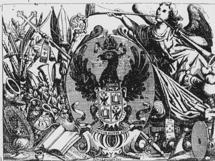
Frontespizio e arma che precede la dedica del Terzo libro de' motetti a voce sola ... opera duodecima, seconda impressione , Bologna, s.e., 1675.

IN BOLOGNA, 1675. Con licetza de' Superiori.