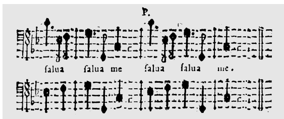
ES. 12, miss. 209-212.

L’impianto formale dell’ incipit è ancora riconducibile a quello delle sezioni n. 4 e 6 (qui « O Iesu salus... | o Iesu spes... »), e più in generale si ha una preponderanza di moduli duali (ad es. « lava... | sana... » etc.). Solo due tasselli rompono la perfetta simmetria di questo gioco costruttivo: il primo « salva me » e l’attacco dell’Adagio (miss. 208-209) che, come marker introduttivo del finale (in sinergia con il cambio agogico dal precedente Presto), assume un