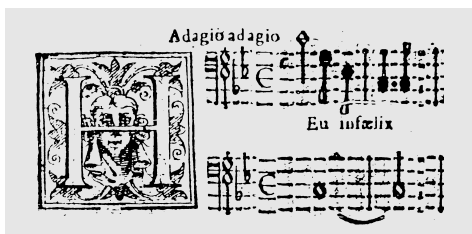
ES. 1, miss. 1-2.

La sezione iniziale, che definiamo ‘recitativo’ per l’evidente orientamento declamatorio, in cui la gestualità retorica prevale decisamente sulla cantabilità, è caratterizzata da due idee pregnanti: a) il motivo d’arpeggio discendente sulle esclamazioni « Heu infelix », « heu misera » (ES. 1), che, posto qui proprio in esordio, tornerà più avanti nel mottetto per altre aperture ed esclamazioni: « Mi Iesu », « Vide Domine », « heu sero »; b) l’utilizzo di note ribattute in andamento cromatico discendente su « peccatorum infecta veneno » (ES. 2).