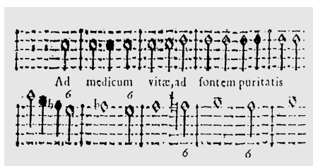
ES. 11, miss. 80 e segg.